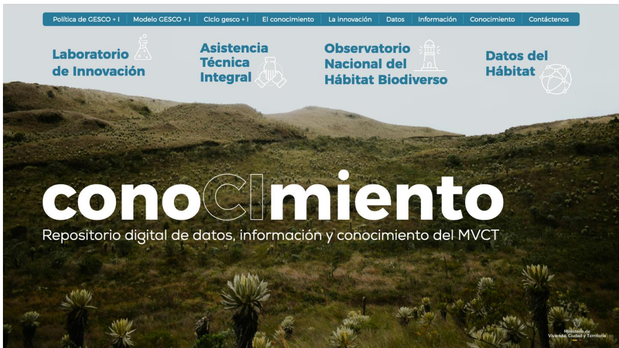
Estructura y diseño propuesto para el sitio web “conocimiento”

Se estructuró, diseñó y se generaron los contenidos iniciales para el sitio web denominado conocimiento, cuyo propósito es servir como repositorio unificado para sistematizar, catalogar y difundir los diferentes activos de conocimiento e innovación del Ministerio: