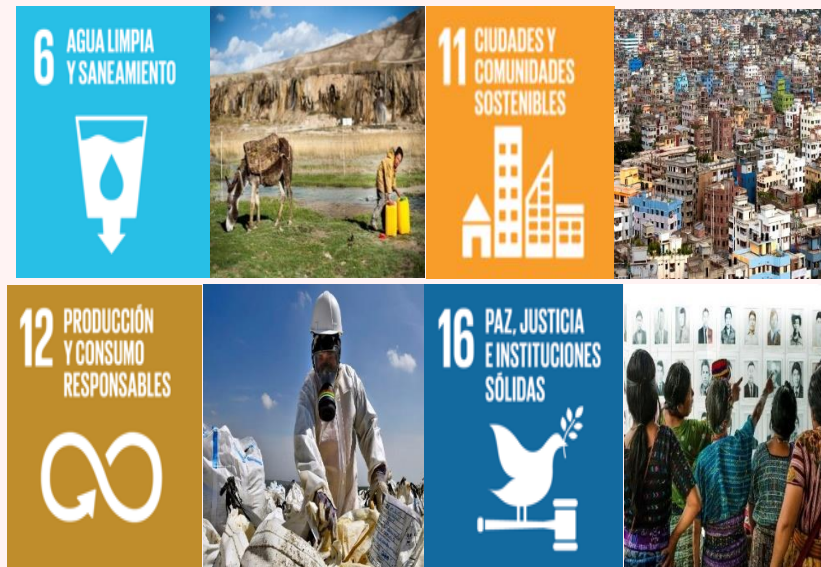
Ilustración 3. ODS articulados con el PEI