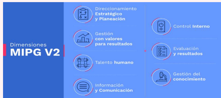
Ilustración 4. Dimensiones del MIGP

El PEI también se articuló con la segunda versión del MIGP, el cual se define como un marco de referencia para dirigir, planear, ejecutar, hacer seguimiento, evaluar y controlar la gestión de las entidades y organismos públicos, con el fin de generar resultados que atiendan los planes de desarrollo y resuelvan las necesidades y problemas de los ciudadanos, con integridad y calidad en el servicio. Los objetivos estratégicos propuestos en el PEI se correlacionan con los diferentes componentes de cada una de las siete dimensiones que se presentan en la siguiente ilustración.