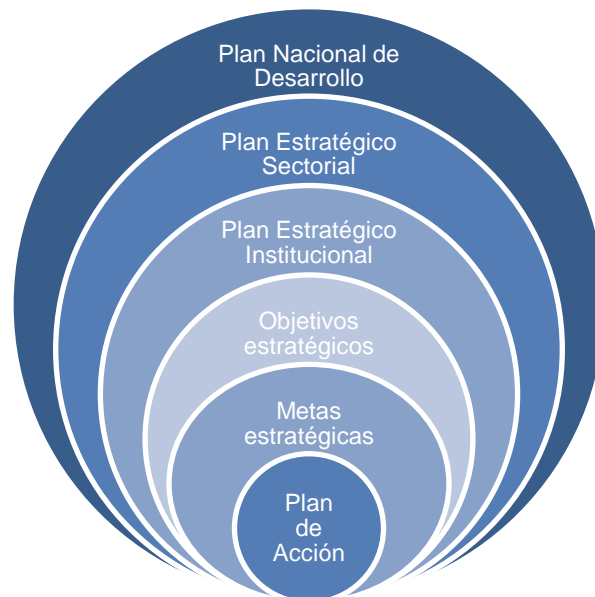
Ilustración 1 Esquema de planeación en cascada adoptado por el MVCT