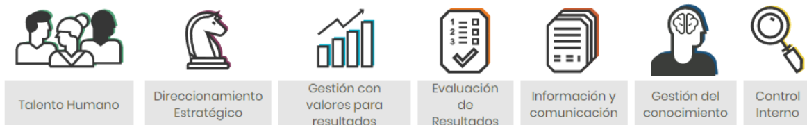
Ilustración 3 Dimensiones del MIPG

Los objetivos estratégicos propuestos en el PES se correlacionan con los diferentes componentes de cada una de las siete (7) dimensiones que se presentan en la siguiente ilustración: